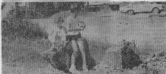
ЗА РЕДАКТОРА Л. М. РАТУЕВА.