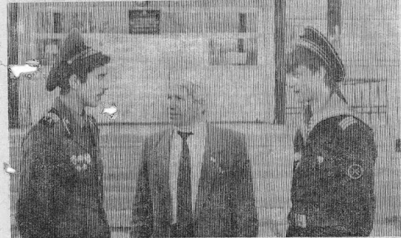
Этот снимок тоже сделан в памятный для выпускников день.

И вот учителя говорят твоим родителям слова благодарности, ты смотришь на маму, у которой слезы радости, размывающие ее макияж, и на папу, необыкновенно взволнованного, и не узнаешь их. В этот миг забываешь об всем на свете, лишь волна счастья захлестнула тебя, и хочешь всем окружающим наговорить кучу добрых и ласковых слов любви и признательности и расцеловать всех. А рядом твои педагоги, которые по старой привычке нет-нет, да и окинут зал своим учительским взглядом. Они рады за тебя и за всех своих учеников, они с гордостью говорят о тебе — их воспитаннице. В том, какой ты стала, и их заслуга немалая. За эти годы всякое бывало, случались и ссоры, и незаслуженные обвинения, но все это позабыто, все кажется пустяком. Сегодня ты всех своих учителей любишь и ценишь, тебе так и хочется