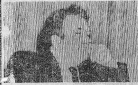
Вступлением секретаря РК КПСС... посвященных XXVIII съезду КПСС.