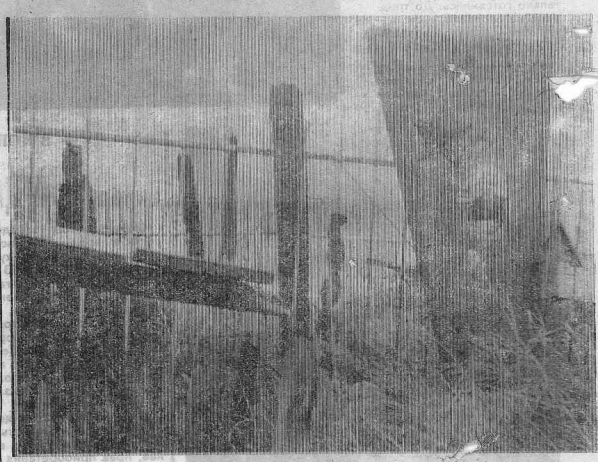
Пашино. Деревенский погост. Не о брениности земного бытия говорит он... Вглядитесь внимательнее в снимок — увидите торчащие обугленные останки не

то деревьев, не то крестов? Да, мы на земле не вечны, но вечной должна быть наша память о предках.