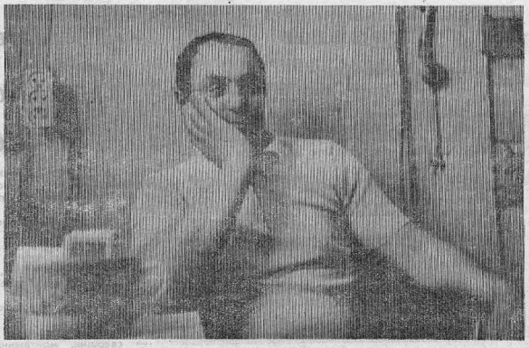
КАЖДАГО РАБОТНИКА ПОДРОБНО ИСПЫТЫВАЮТ ДОТЛОВА