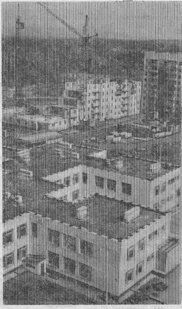
ГОРОД КОДИНСК СТРОИТСЯ.