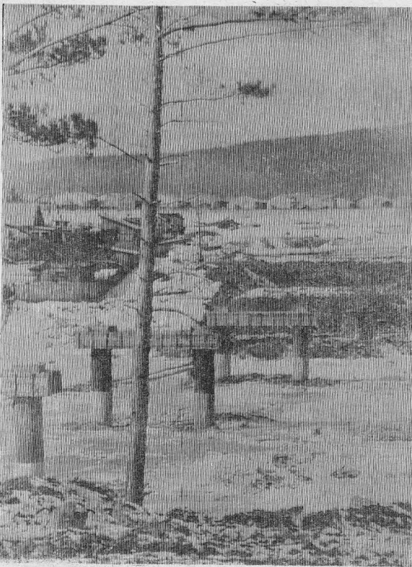
Наконец-то намелились контуры долгожданного для жителей Заледеево моста через р. Чадобец. Строительство его начато в ноябре прошлого года, а завершение намечено на конец 1991-го. Воз-

водит его отряд Усть-Кутского мостостроительного треста. Длина моста 250 метров, ширина проезжей части — девять.