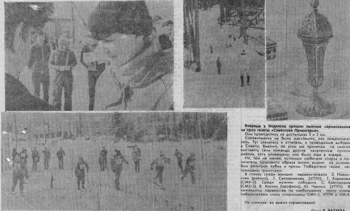
Впервые в Кодкинске прошли лыжные соревнования на приз газеты «Советское Приангарье».

Они проводились на дистанциях 3 и 5 км. Соревнования не были массовыми, как предполагалось. Тут сказались и оттепель, и проводимые выборы в Советы. Видимо, по этим же причинам не смогли выставить свои команды другие населенные пункты района, хотя оповещены они были еще в январе. Но, тем не менее, истинные любители спорта и почитатели здорового образа жизни вышли на лыжню. Был разыгран кубок и призы. Победители также награждены грамотами.