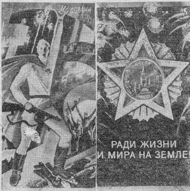
РАДИ ЖИЗНИ И МИРА НА ЗЕМЛЕ!

В КРАСНОЯРСКЕ готовится Книга Памяти о тех людях, которые не ждали самого дорогого для каждого человека — своей жизни, отдавая ее на полях сражений с германским фашизмом в годы Великой Отечественной войны. Но краевое издательство надеется осуществить в этом году выпуск такой Книги только по Красноярску. И лишь по той простой причине, что точных данных о погибших воинах пока на периферии еще не собрано. Похоронки, как называли в те страшные годы извещения о смерти своим семьям, затеряны. Кроме того, в нашем Кежемском райвоенкомате, например, не сохранились документы призыва в армию резерва 1925 и 1926 годов рождения. Еще большая трудность в восстановлении памяти погибших на фронтах Великой Отечественной в населенных пунктах, переданных в наш район из Богучанского. Это такие села и деревни, как Яррино, Юрхота, Чадобин, Зелёвое, Каминно, Сербиоловото, Ирга и Видя. Сведения по этим населенным пунктам приходится брать из Богучанской районной газеты «Ангарская правда».