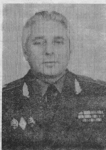
Кандидат в народные депутаты Красноярского краевого Совета