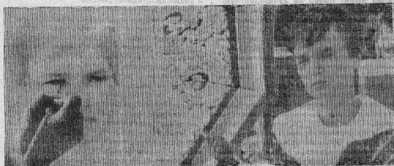
ИЗ СЕРИИ «АРБАТ».