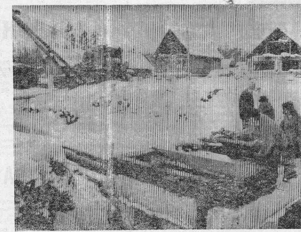
«ИНДИЯ». г. Козинск.