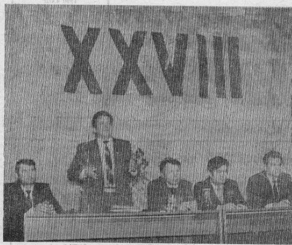
Накануне XXVIII районной отчетно-выборной партийной конференции состоялся пленум РК КПСС, на котором были обсуждены волнующие коммунистов.