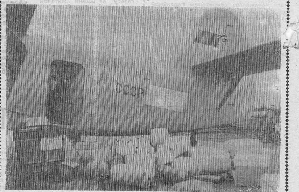
Постараться доставить каждому послужку в целостности и сохранности — казалось бы, это долг всякого, кто хоть как-то образом связан со сферой почтового обслуживания. Но видишь вот такое