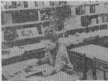
жается, падает посещаемость. Сегодня перестройка в стране затронула и библи-