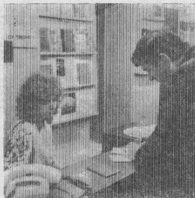
В. И. Ленин видел в библиотеках главный инструмент проведения в стране культурной революции. К