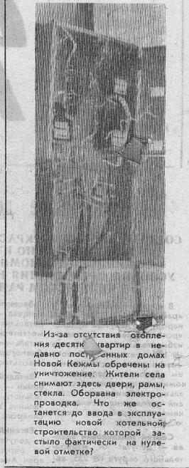
Из-за отсутствия отопления десяток квартир в недавно построенных домах Новой Кежмы обречены на уничтожение. Жители села снимают здесь двери, рамы, стекла. Оборвана электропроводка. Что же останется до ввода в эксплуатацию новой котельной, строительство которой застыло фантасически на нулевой отметке?