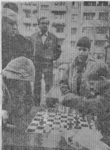
На снимках запечатлены моменты праздника.

О ПРАЗДНИКЕ ДВОРА, КОТОРЫЙ ПРОХОДИЛ В РАЙЦЕНТРЕ, РАССКАЗЫВАЮТ В. РАТУЕВ (ФОТО) И Л. МЯЛО