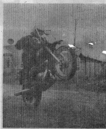
ФОТОЗЮД. «Прыжок в неизвестность».