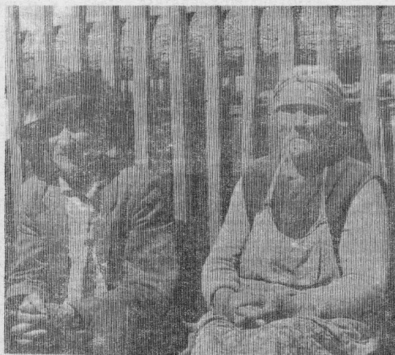
«Закаты» — так назвал свою зарисовку корреспондент В. РАТУЕВ.