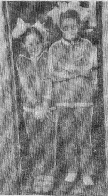
«ОЛИМПИЙСКИЙ РЕЗЕРВ» ИЗ ИРБИ.