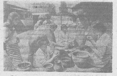
47-й километр Байкальского тракта под Иркутском... Редкий проезжий по дороге на Байкал не свернет чуть в сторону, в архитектурно-этнографический музей под открытым небом.

— Выделить дополнительные места в детских садах не представляется возможным.