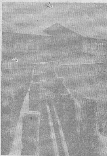
На снимке: климинская школа. Сегодня здесь нет вторых рам, ч. побелке, покраске только приступили. В котельной нет оборудования, да и непонятно каким образом будет устанавливаться котел — двери и окна малы для него. Вероятно, придется ломать перегородки или добротн поставленные стены.