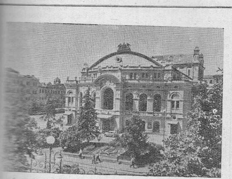
Государственный академический театр оперы и балета в Тюмени Т. Г. Шевченко.